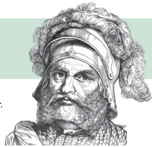
Georg von Frundsberg, Landsknechtsführer

1. Ergänze den Lückentext mit den Wörtern aus dem Wortspeicher.