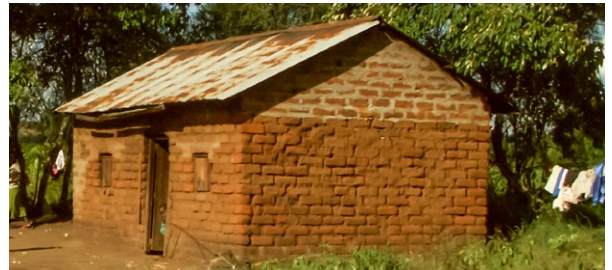
In diesem Haus wohnen Mutili und ihre Schwester zusammen mit ihren acht Kindern.